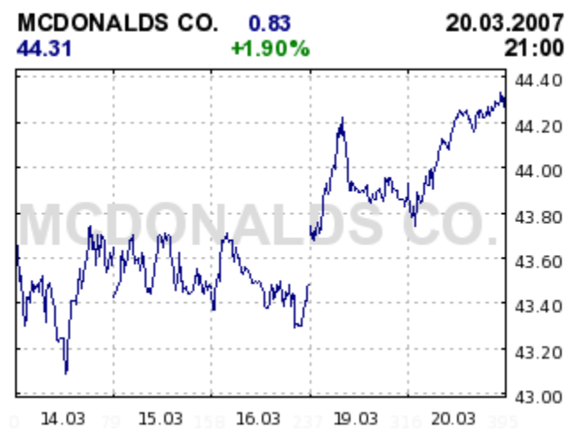
Obrázek 3: Graf vývoje hodnoty akcií

Ke konci včerejšího dne se akcie firmy McDonalds obchodovali za $ 44.31 , v průběhu předcházejících 5 dnů byl následující vývoj.